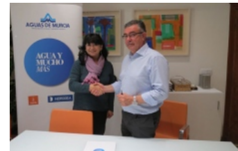
Emuasa firma un convenio de colaboración con Internón Oxfam